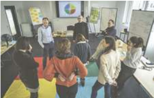
Abb. 2 Die Arbeitsgruppe schätzt ihre Denkpräferenzen ein und diskutiert sie

nicht als klassischer Test zu verstehen. Sie soll lediglich helfen, die Denkpräferenzen von Menschen einzuschätzen, um so die individuellen Vorlieben und Kompetenzen für eine erfolgreiche Zusammenarbeit im Team nutzen zu können. Um zu verstehen, wie Lösungen entstehen, ist es nämlich wichtig, über das eigene Denken und Handeln und das des Gegenübers Klarheit zu gewinnen.