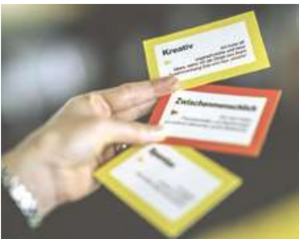
Abb. 3 HBDI-Spielkarten einer teilnehmenden Person

Da eine klassische Auswertung in der Zeit nicht möglich war, hat sich das Team dem Thema spielerisch genähert, indem jede Person sieben Karten mit Eigenschaften erhielt. Diese waren analog dem HBDI® mit Farben gekennzeichnet. Alle Teilnehmenden konnten nun im Raum umhergehen und ihre Karten so lange tauschen, bis sie das Gefühl hatten, die Begriffe auf den Karten spiegeln ihre Persönlichkeit wider. Danach musste jeder für sich die Karten in eine Reihenfolge bringen, wonach die oberste Karte am meisten zutraf und graduell eine Abstufung stattfand. Zum Abschluss mussten alle Personen mit den drei obersten Karten von einer Situation erzählen, in der sie die beschriebenen Eigenschaften wahrnahmen. Dies war eine spannende Übung, um sich im Vorstand noch besser kennenzulernen und mit der Aufstellungsarbeit zu erleben, wo die anderen »stehen«.